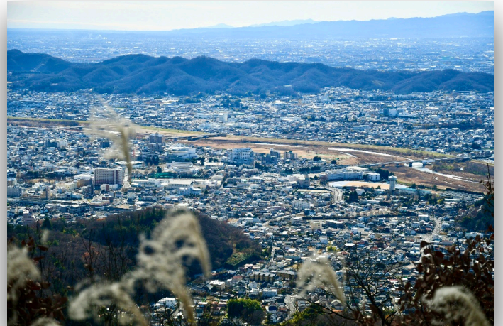
『足桐に魅かれ師走の両毛線』 吾妻山頂より