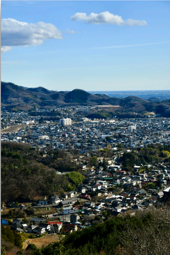
『箱庭の街ひとり占め冬木立ち』 トンビ岩より