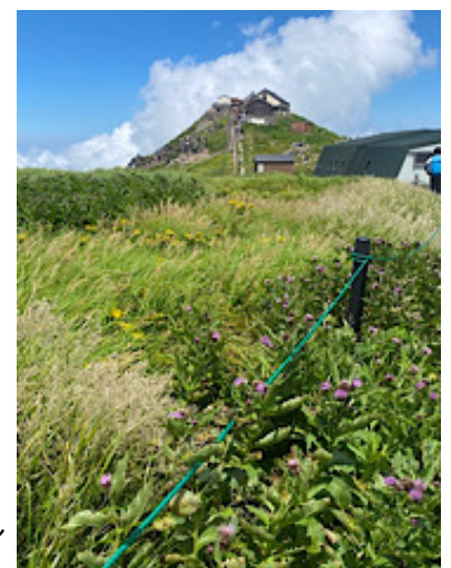
月山神社(中央)と 月山山頂小屋 間的小屋はトイレ