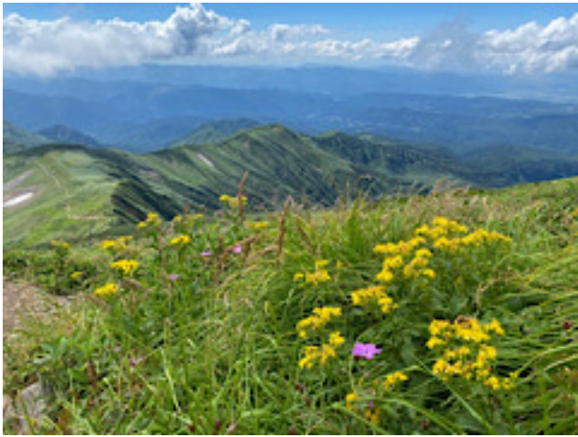
山頂近くのお花畑 急登の疲れが癒やされた