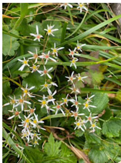
ダイヤモンドソウ