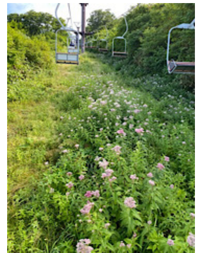
リフト下はお花畑

最終リフトが気になり急いで降りたが、ダイレクトに展望が目に入り、疲れも忘れ心惜しさを感じながら一気に下った。