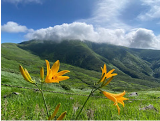
月山は雲の中(姥ヶ岳登りより)