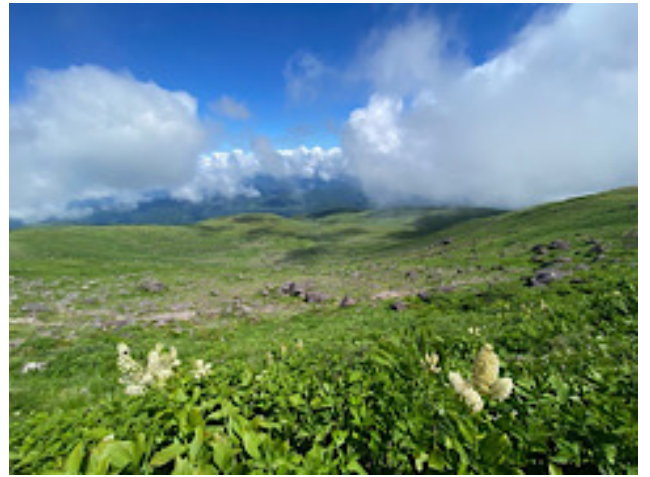
山頂部東側 まさに月面