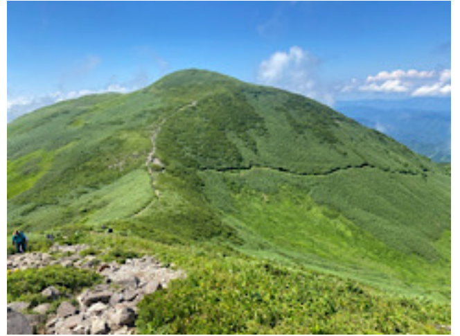
振り返ると姥ヶ岳 花が多かった