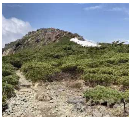
剣が峰分岐側からの見た山頂付近