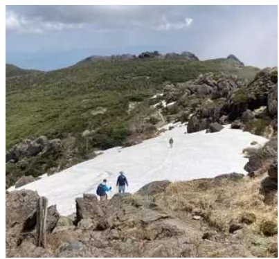
山頂側からの見た剣が峰分岐方面