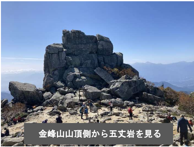
金峰山山頂側から五丈岩を見る