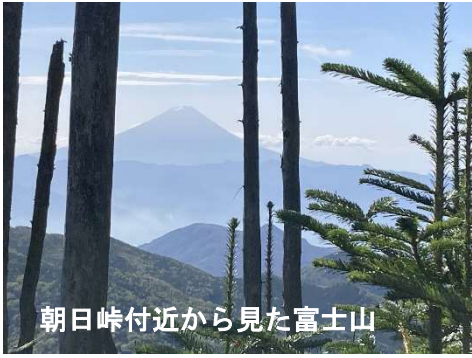
朝日峠付近から見た富士山