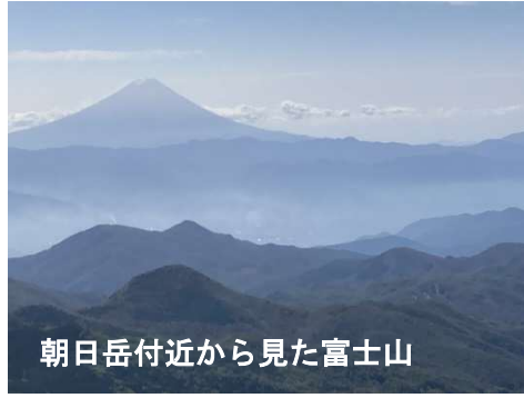
朝日岳付近から見た富士山