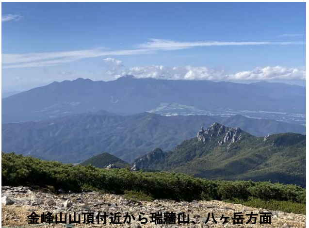
金峰山山頂付近から瑞穂山、八ヶ岳方面