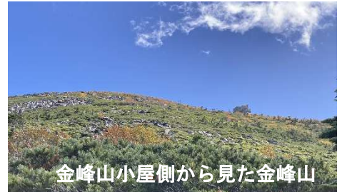
金峰山小屋側から見た金峰山