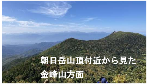
朝日岳山頂付近から見た 金峰山方面