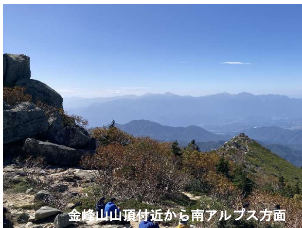
金峰山山頂付近から南アルプス方面