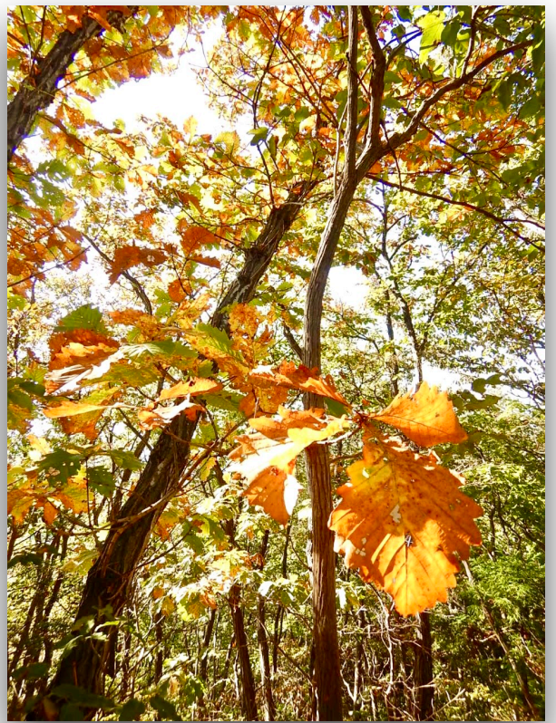
行道山付近の黄葉