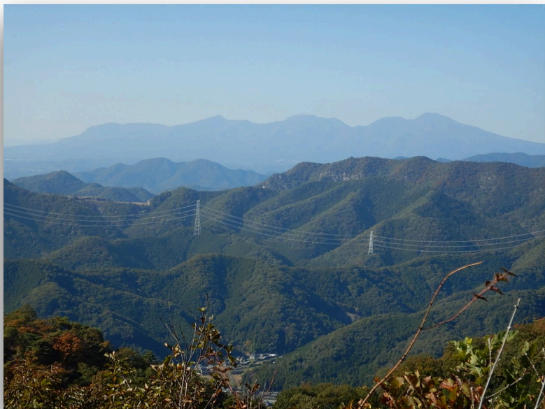
行道山より石尊山・赤城山