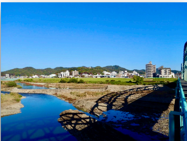
中橋から渡良瀬川と足利の山並 中央右に両崖山