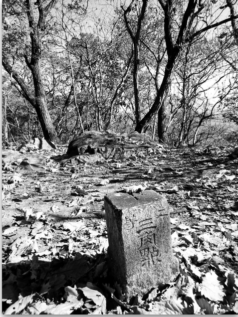
石尊山の二等三角点