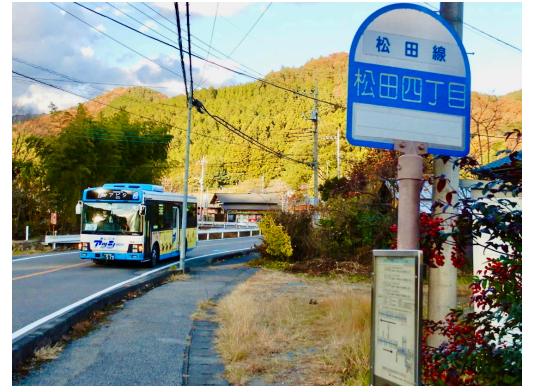
アッシーとナンテン